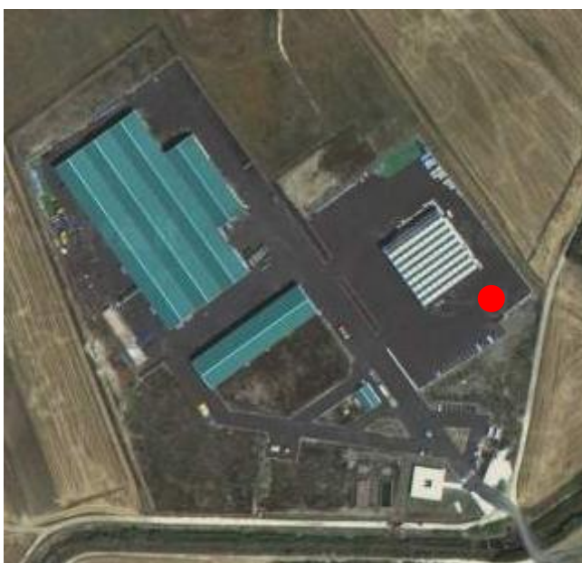
Figura 1 - Individuazione del sito

L'intervento progettuale interessa il Centro Integrato per il trattamento dei rifiuti provenienti da raccolta differenziata sito nel territorio comunale di Grammichele in c.da Poggiarelli, a nord-ovest del centro abitato. L'area in cui verrà realizzato l'impianto di distribuzione carburanti è pianeggiante ed è posta a quota 210 m s.l.m..